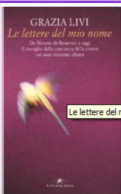
Le lettere del mio nome , Grazia Livi GEN.B00.03547

«La mia vita è una storia di parole pensate», afferma Grazia Livi, giornalista, scrittrice e raffinato critico letterario. E con le parole e le vite delle maggiori scrittrici e protagoniste del Novecento si confronta in “Le lettere del mio nome”, romanzo-saggio che le valse il Premio Viareggio nel 1991 non solo per l’originalità dell’impianto ma anche per la sua forte cifra anticipatrice.